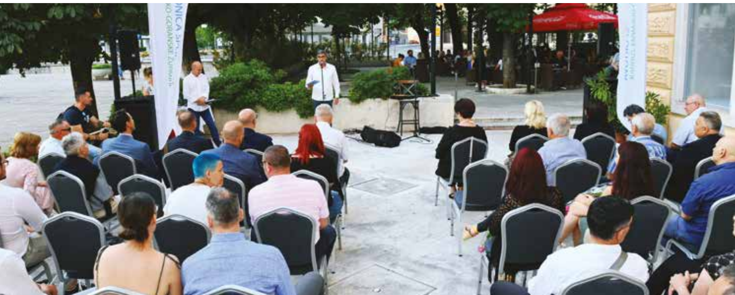
Dodjela nagrada najuspješnijim sportašima desetljeća održana je u Rijeci na otvorenom zbog epidemioloških mjera

Zbog izbijanja pandemije 2020. godine i smanjenih sportskih aktivnosti umjesto tradicionalnoga godišnjeg izbora birani su najuspješniji sportaši desetljeća u Primorsko-goranskoj županiji.