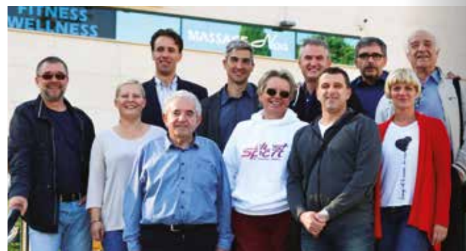
Organizacijski odbor prvih međuzupanijskih sportskih susreta

Tijekom dosadašnjih 5 susreta bili su zastupljeni sljedeći sportovi: odbojka - djevojke 2017. Opatija, odbojka - dečki 2018. Osijek, košarka - dečki 2019.