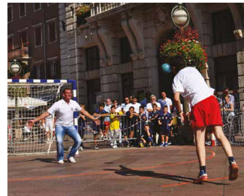
Druženje riječkih olimpijaca sa mladim sportašima