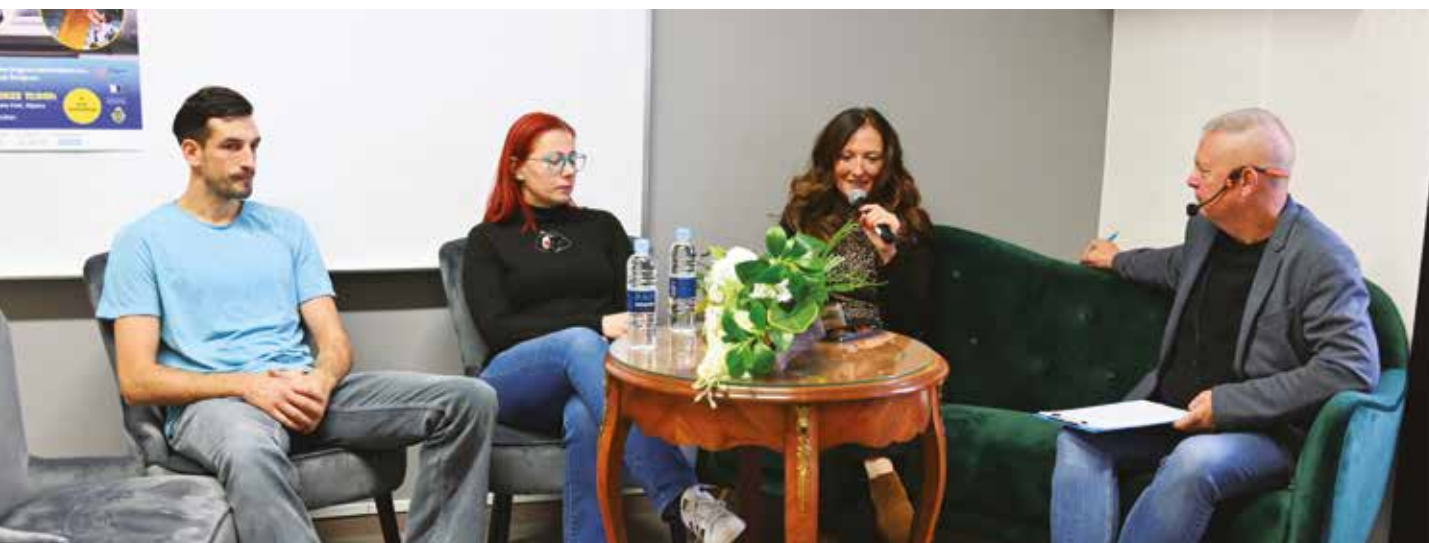
Panel rasprava o dualnoj karijeri sportaša privukla je veliki interes sportske javnosti

otvoriti raspravu o problematici sa kojom se sportski treneri i klubovi susreću na svim razinama natjecanja. Projekt "Sportskog dnevnog boravka" izazvao je pažnju sportske javnosti i planira se nastaviti s novim temama.