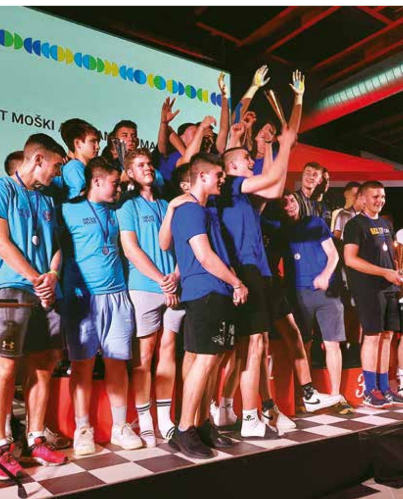
Sportska delegacija PGŽ-a u četiri je navrata osvojila prijelazni trofej Igara prijateljstva

Sportska manifestacija „Igre prijateljstva“ međunarodni je projekt koji su 2002. godine utemeljili Savez sportova Unsko-sanskog kantona (Bosna i Hercegovina) i Savez sportova Ličko-senjske županije (Hrvatska), a odmah nakon toga, pridružilo im se i Novo mesto. U početku je cilj ove manifestacije bio okupiti mlade koji su živjeli na ratom zahvaćenim područjima kako u Hrvatskoj tako i u Bosni i Hercegovini. Tijekom godina kroz razne sportske igre stvarao se pozitivan natjecateljski duh, a naglasak je stavljen na druženje i međusobno prijateljstvo mladih, te upoznavanje različitih kultura i običaja. Igre su ubrzo prerasle u veliki sportski