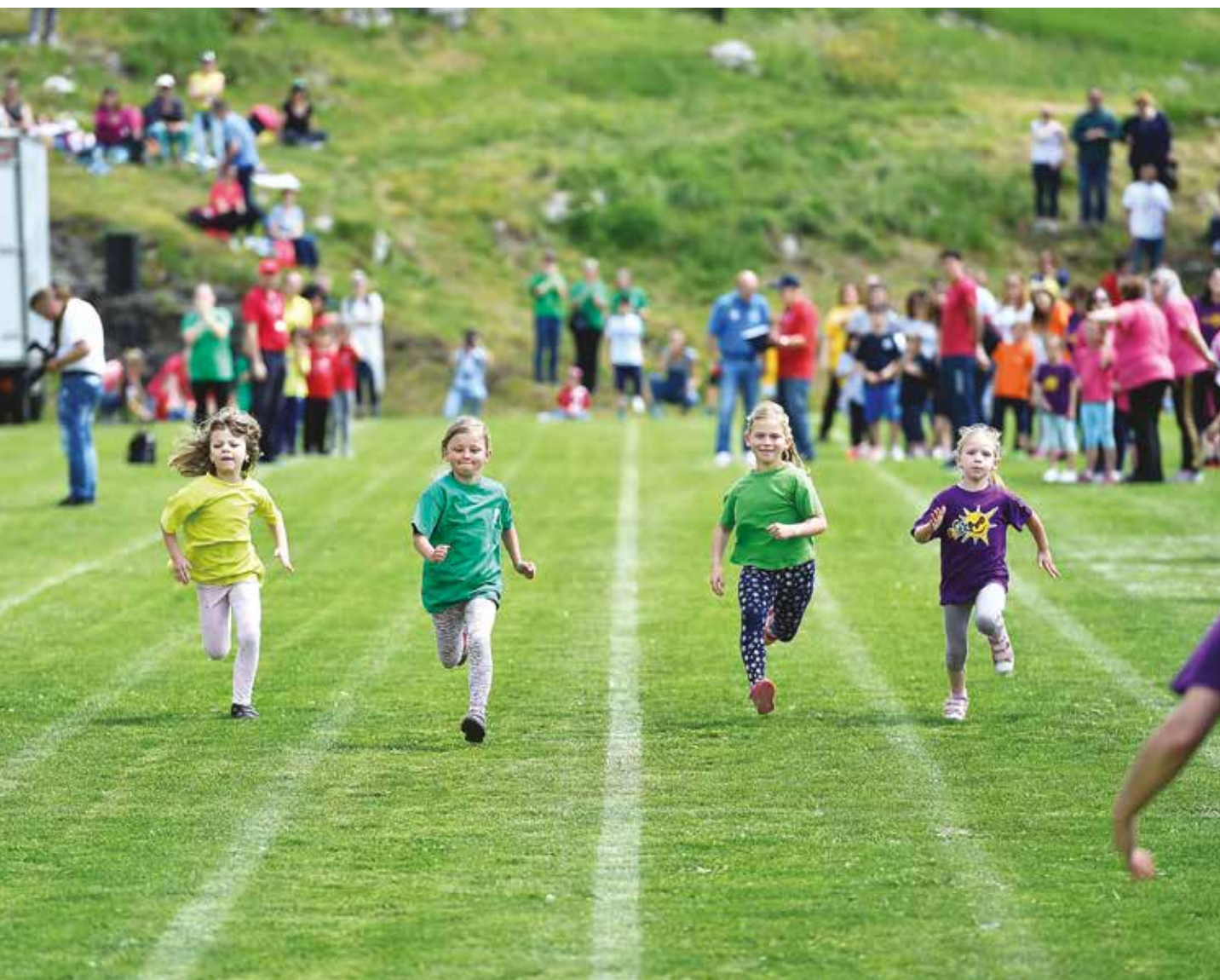
Utrka djevojčica na 50 metara u Munama 2018. godine