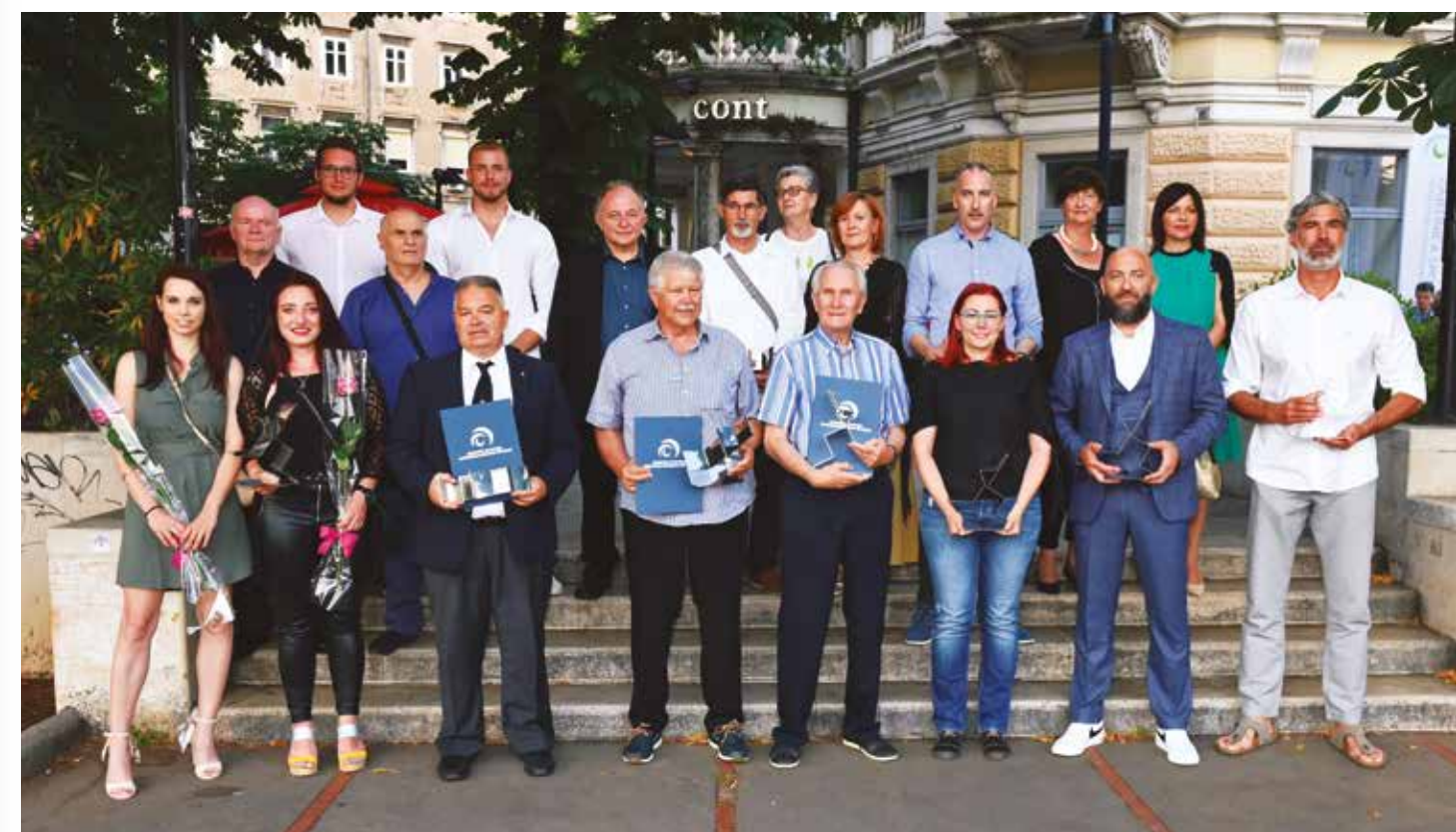
Sportaši, sportašice i predstavnici sportskih klubova desetljeća Primorsko-goranske županije