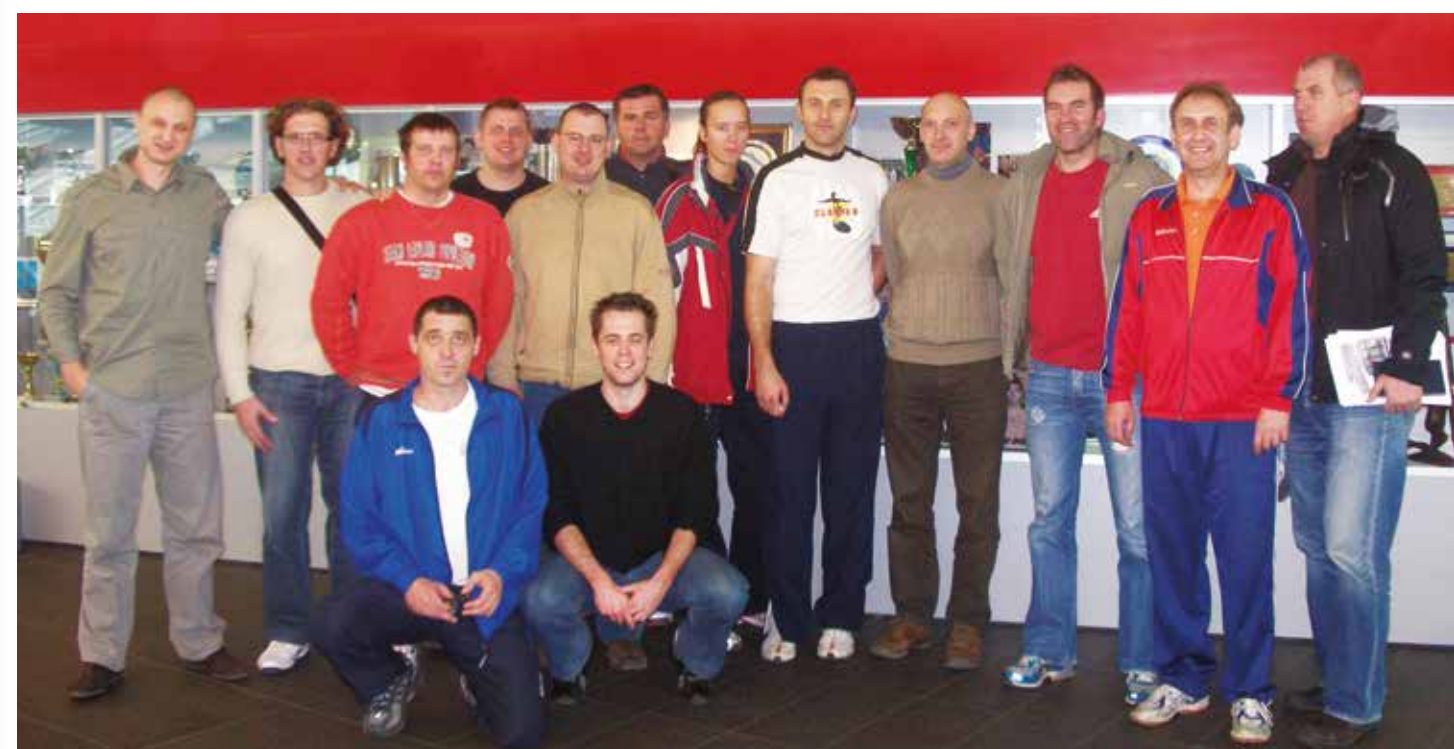
Polaznici Stručnog studija za izobrazbu trenera odbojkaškog usmjerenja