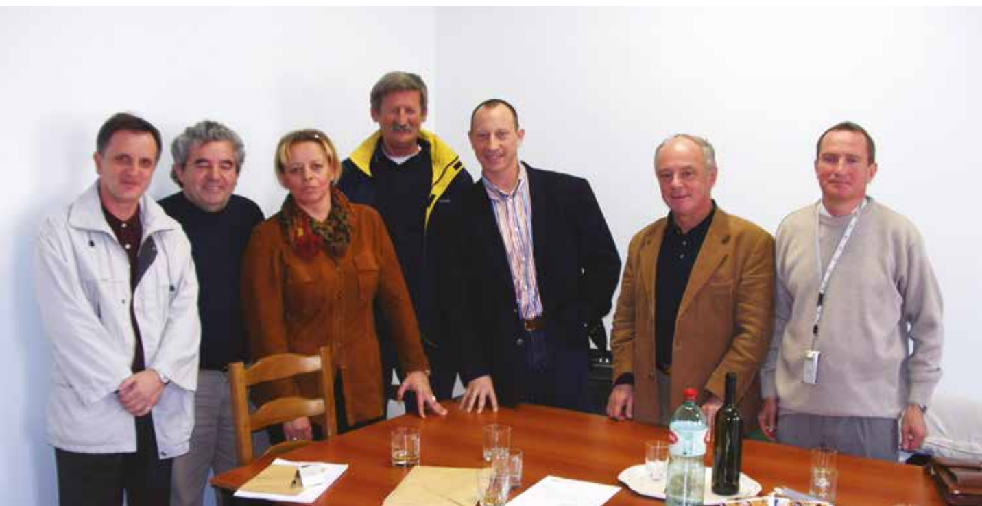
U 25 godina Zajednice sportova PGŽ-a kroz Izvršni odbor prošlo je 33 sportskih djelatnika i djelatnica

Priča o 25. godišnjici djelovanja Zajednice sportova Primorsko-goranske županije započela je na Osnivačkoj skupštini održanoj u Rijeci, 22. travnja 1997. godine. Zbog važnosti toga dokumenta za povijest sporta u PGŽ-u i Hrvatskoj predstavljamo ga u izvornom i nepromijenjenom obliku.