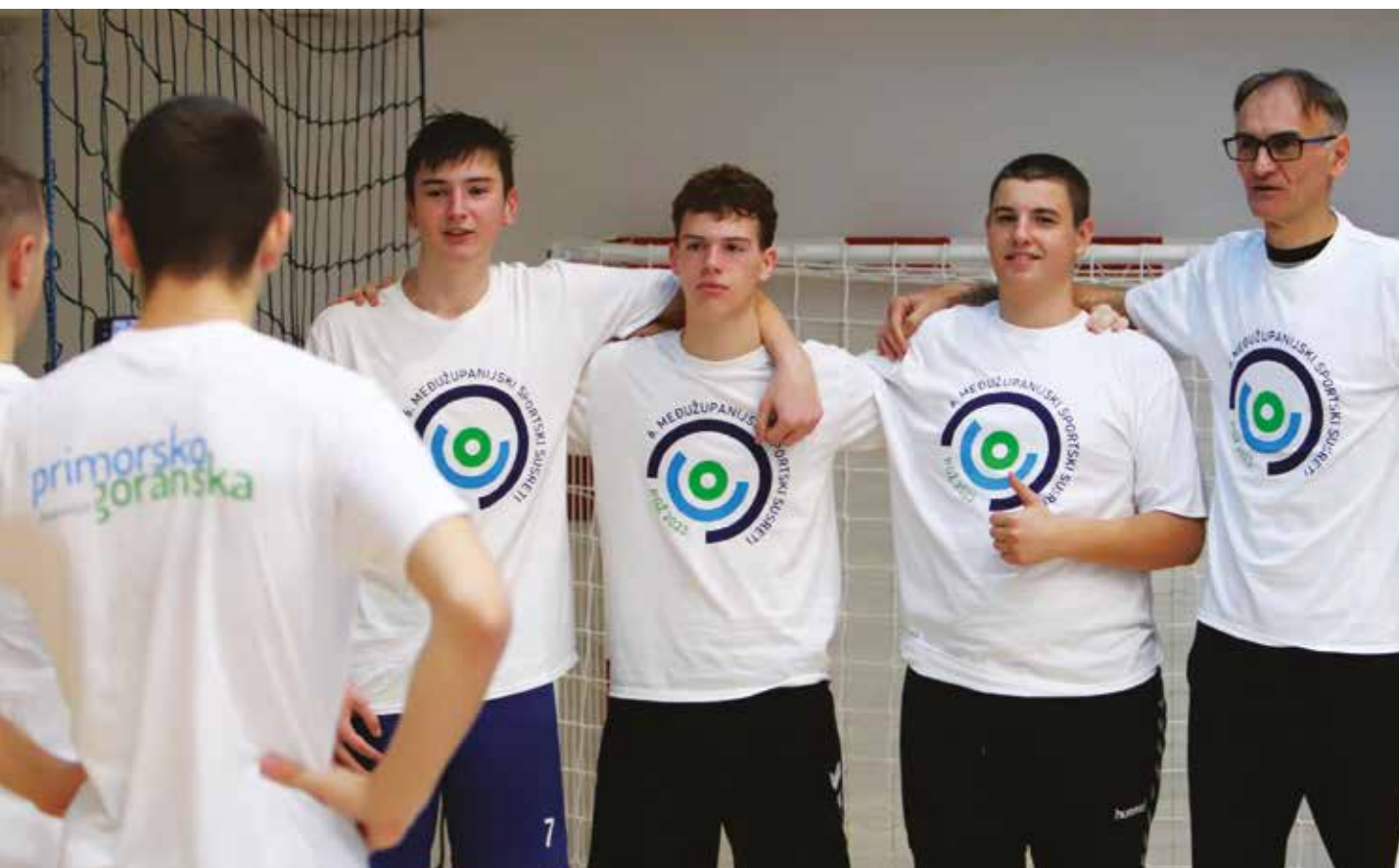
Rukometna selekcija Primorsko-goranske županije s trenerom

No, uvijek je riječ o sportašima mlađih dobnih uzrasta. Kroz ta nadmetanja stvaraju se odabirom najtalentiranije djece županijske selekcije u pojedinim sportovima. Uz to održavaju se radni sastanci delegacija. Potporu ovim susretima daje Ured za programe sporta na lokalnoj razini Hrvatskog olimpijskog odbora.