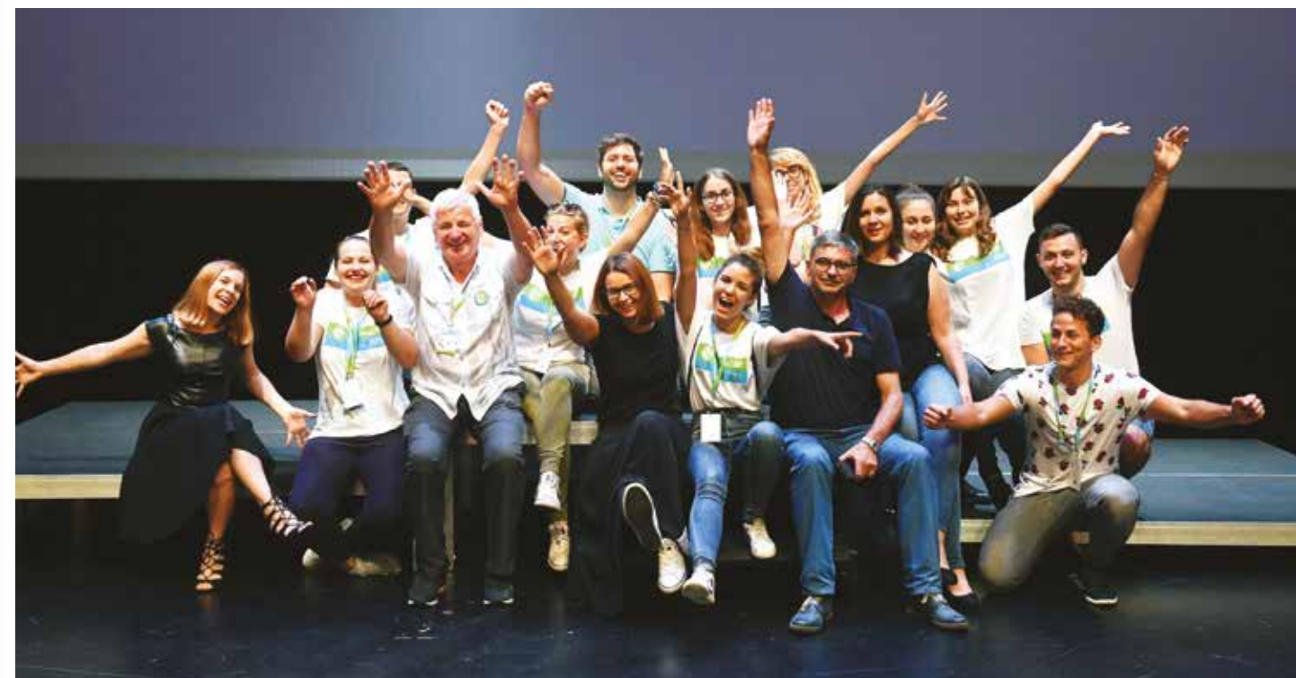
Organizacijski tim Igara prijateljstva 2018. godine u Rijeci

cija Igre prijateljstva je zasigurno najznačajniji međunarodni projekt Zajednice sportova Primorsko-goranske županije. Ova manifestacija nema samo sportski značaj već i veliku kulturno socijalnu vrijednost za sve sudionike. Jubilarne 20. Igre prijateljstva bit će održane 2024. godine u našoj županiji u organizaciji Zajednice sportova.