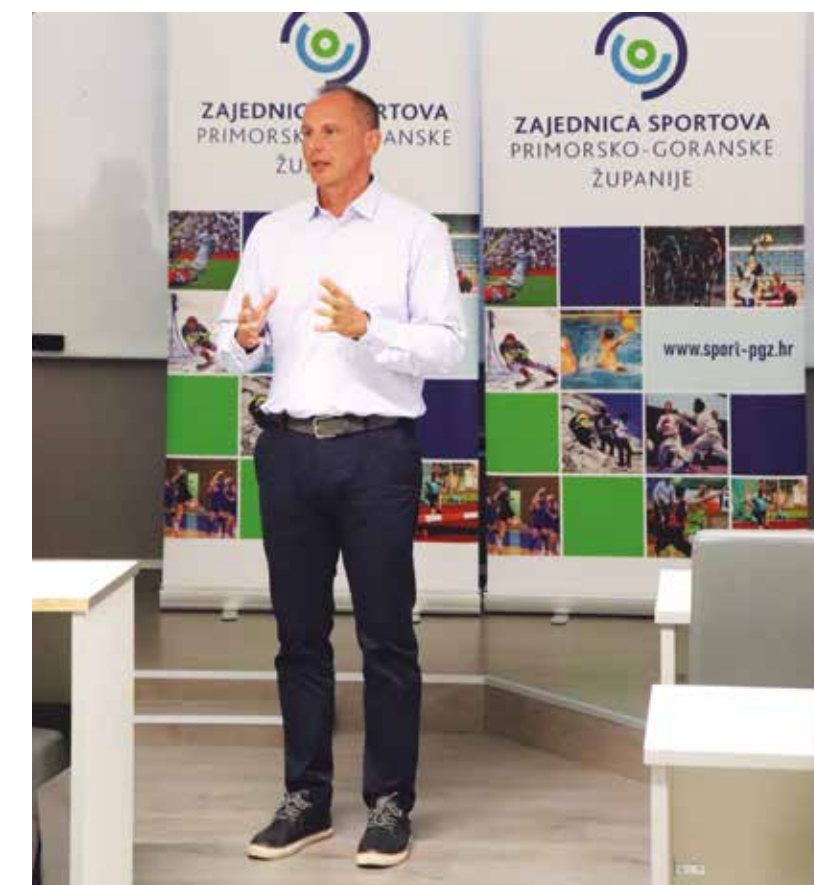
Ravnatelj Hrvatske olimpijske akademije na jednom od predavanja

Dio obrađenih tema: Mehanizam nastanka ozljeda, Uzroci, prevencija i oporavak kod sindroma pretreniranosti, Radionica s prikazom prve pomoći na terenu, Osnove i specifičnosti prehrane djece i mladih sportaša, Sportska psihologija, Dugoročni plan razvoja mladih sportaša i senzitivne faze razvoja, Kondicijski operateri kod mladih sportaša, Vodič za uporabu sportskih rekvizita, Važnost tjelesnog vježbanja u predškolskoj dobi, Predstavljanje projekta - Olimpijska radionica, Sportski administrator - predstavljanje programa, Tjelesna aktivnost u prirodi i mentalno zdravlje, Priprema sportaša za prijelaz iz juniorskih u seniorske kategorije, Kako do punih tribina u nižim ligama?